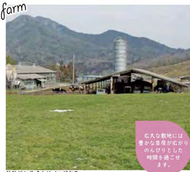
放牧地に牛舎とサイロがある

芝生の上で演奏会を開催します。牛の耳や模様をつけて遊びにきてね。駐車場最大120台。