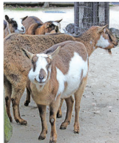
ヤギとはブラッシングでふれあえます