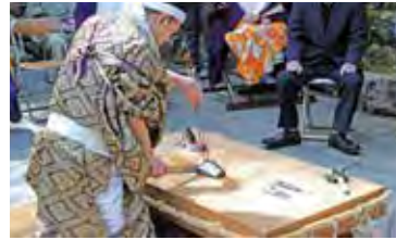
直接触らないよう鯉を切ります

包丁供養は、使わなくなった包丁に恩恵と感謝を捧げ、調理された霊を包丁と共に供養し、大聖院内の包丁塚に奉納するもの。毎年一般の家庭からも供養する包丁を募集していま