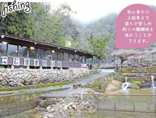
お食事処の前の流るる川が釣り堀です

と。ちなみに夏は水温の低い朝・夕方方が釣れやすく、春はどの時間でも釣れやすいそう。釣れる魚は主にニジマスとサーモン。特にGW期間中は毎日サーモンを放流しています。姉妹店の「七瀬川溪流釣り場」との主な違