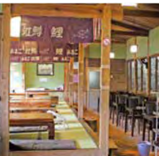
暖かい日は外のテラスでも食べられます

広島市三滝少年自然の家 アスレチック 合宿所としても有名な三滝少年自然の家では、自由に遊べる20種類の屋外アスレチックがあります。敷地内には多種多様な植物が茂っていることから、野鳥も多く見られます。5月以降はキビタキやオオルリといったアスレチックの入口にある「冒険橋」