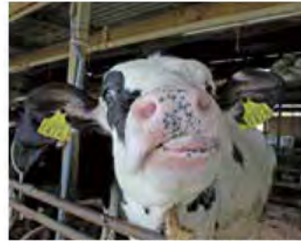
エサやりができる生後1年ほどの若い牛

「砂谷牛乳」を生み出す牛たちが生活するサゴタニ牧場では、広大な芝生で寝転がったり、牛舎の一部に入つて見学ができます。また、ジェラートや新鮮な牛乳を、作ってくれた牛たちを見ながら味わえます。牛たちと同じように地面に座りながら、のんびりした時間を過ごすのもいいかもしれませんね。今年始まったいちご狩りも5月まで続いています。