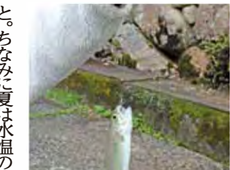
エサを入れてすぐニジマスが釣れました