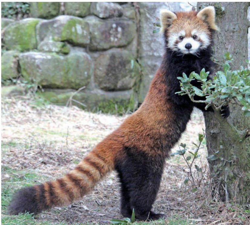
木に登ろうとするレッサーパンダ

春になりおでかけしやすい気候になってきました。1面・2面では、地元の動物園・釣り堀・屋外アスレチック・牧場のほか、5月に開催される「メダカ祭り」を紹介しています。ぜひ週末の日帰り旅行やGWの参考にしてください。