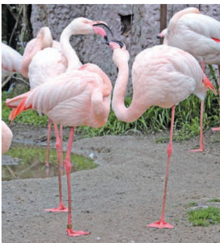
鮮やかなオオフラミンゴ

オフラインや大鳥舎でヒビが生まれることが多いそう。気温が高くなると、ヒビや亀が活動的になり、「シフゾウ」の巨大な角が生え変わったり、レッサーパンダが短毛になったりと、冬とは様相が変わります。また、現在安佐動物公園は30年〜40年後を見据えた再整備基本計画の真っ最中。まず2022年に新ゾウ舎を建て、マルミゾウのオスを新しく迎えました。今もアフリカゾウの改築中で、約4年後には新しく「ゴビトカバ」が来る予定です。変わりゆ