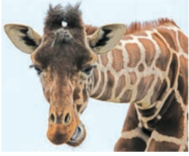
反芻をするキリン

その他にも、飼育員によるお話イベントや、ポニーの乗馬、テジクネズミなどのふれあいタイムがあります。詳細は公式HPで。(2面に続く)