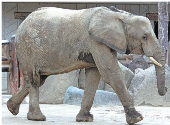
大きな耳のサバンナゾウ

の「アヌビスヒヒ」の群れが生息しています。開園時からほとんど人の手が入っておらず、一つの群れとして自然に赤ちゃんが生まれ、自然に還っていきます。また例年、GW前後に赤ちゃんが生まれるので、4月〜5月は可愛い赤ちゃんが見られるかもしれません。アヌビスヒヒは、アフリカに生息し、20頭〜100頭ほどの群れを作る雑食性の動物。他の