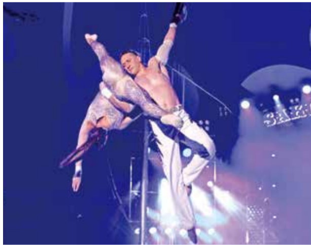
空中でのエアリアルストラップ