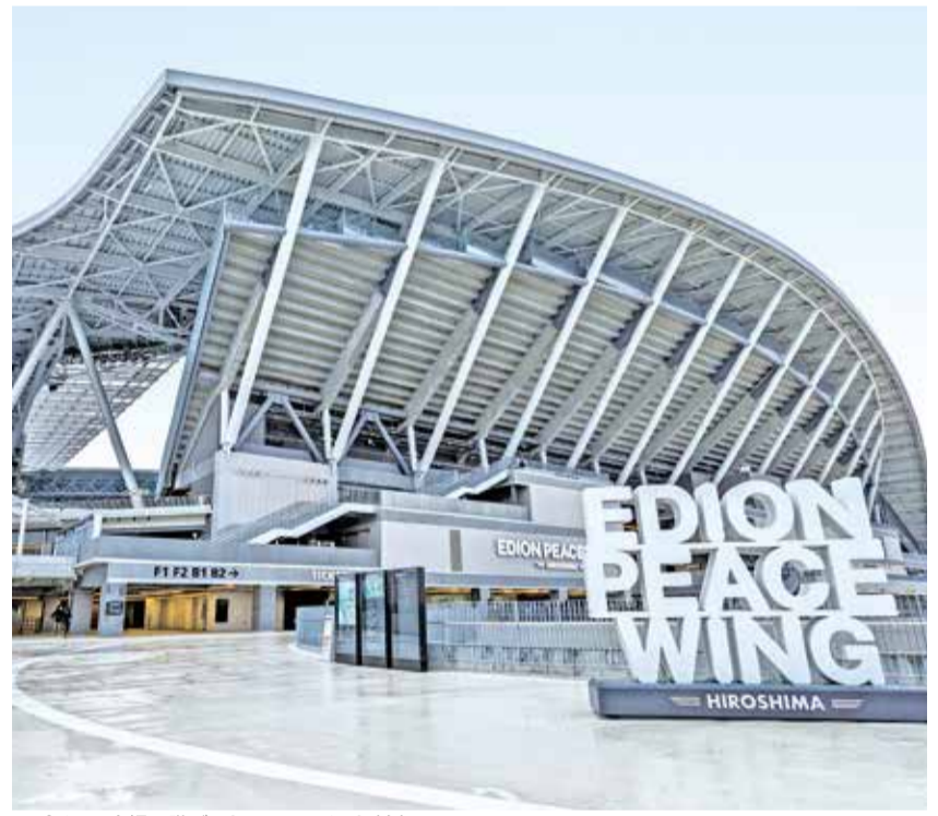
スパイラル広場2階デッキのモニュメント(右)

ミュージアムでは、サンフレッチェ広島や歴代のユニフォームや島のサッカーの歴史が展示されています。また、体験型のコンテンツとして、ボールを使ってシューティングゲームが楽しめます。 全選手を網羅した商品から県の特産品まで、以前のストアと比べて3倍のアイテムを販売しています。日常使いできるアパレル商品が特に充実。推し選手のオリジナルグッズを制作できるコーナーも新しく設置しています。スタジアム開業記念グッズは定番のTシャツ・タオルなどはもちろん、ナイキとコラボした限定デザインのスニーカー「エアフォース