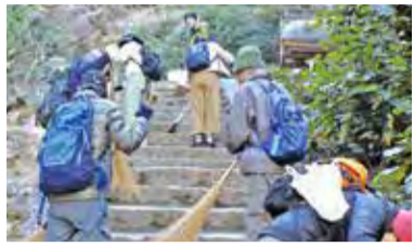
登山道の清掃活動

保全活動、調査研究、弥山の価値発信などをメインに行っています。中でも最も活動的なのは保全活動。月に一度、弥山の登山道を清掃しています。登山道は季節によりは落ち葉や砂で滑りやすくなるので、登山客の安全を守るためにも清掃を続けていま