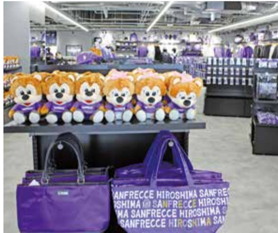
ストアの売り場面積は400㎡

バックスタンド1階のミュージアムでは、サンフレッチェ広島や歴代のユニフォームや島のサッカーの歴史が展示されています。また、体験型のコンテンツとして、ボールを使ってシューティングゲームが楽しめます。 全選手を網羅した商品から県の特産品まで、以前のストアと比べて3倍のアイテムを販売しています。日常使いできるアパレル商品が特に充実。推し選手のオリジナルグッズを制作できるコーナーも新しく設置しています。スタジアム開業記念グッズは定番のTシャツ・タオルなどはもちろん、ナイキとコラボした限定デザインのスニーカー「エアフォース