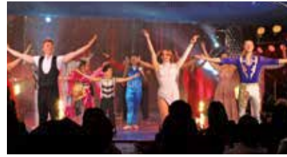
ショーのアーティストたち