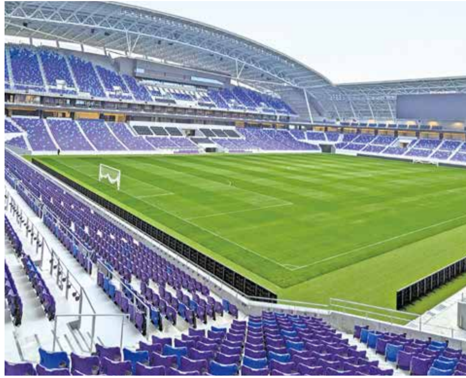
紫と緑のコントラストが美しい

サンフレッチェ広島の新拠点となるスタジアム「エディオンピースウィング広島」が2月、開業しました。原爆ドームから歩いて13分の「まちなかスタジアム」です。 地上7階建てで、観客収容数は中四国最大の2万8520人。国際試合の開催にも対応できるスタジアムです。湾曲した大きな屋根を「鳥の翼」に見立てており、紫青・白に塗られた 座席は川面から眺めるしぶきを表現しています。フィールドの広さは84m×121m、グラウンドは68m×105m。ピッチと座席最前列との距離は約8mで、最前列付近は選手と観客の目線がほぼ同じになるよう設計されています。 メインディスプレイはマツダスタジアムより大型の縦9m×横32mで、リボンビジョンは全長380m。16台のムービング ライトと最新音響設備は試合中も連動し、体感ある演出で臨場感と躍動感を生み出します。